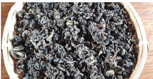
ຮູບທີ 3: ຊາຂຽວໃນຮູບຮ່າງເປັນກ້ອນ