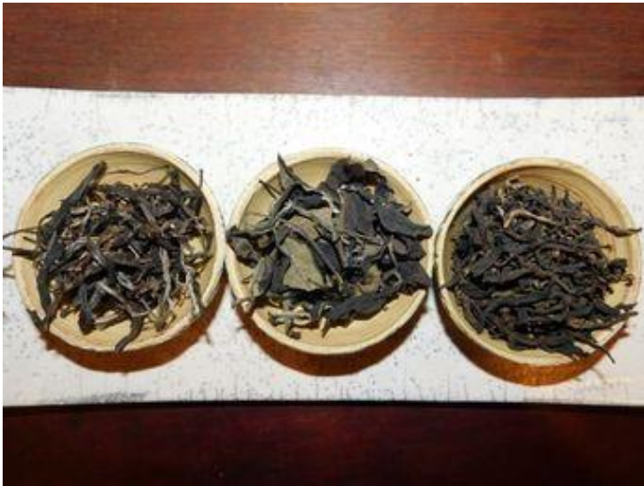
ຮູບທີ 2: ຈາກຊ້າຍ ຫາ ຂວາ ຊາຂຽວ, ຊາຂາວ ແລະ ຊາແດງ

ຊາກຳແມນ ທີ່ເປັນຜະລິດຕະພັນສຳເລັດຮູບ ທີ່ມີຂາຍໃນຮູບຮ່າງຕ່າງໆ: