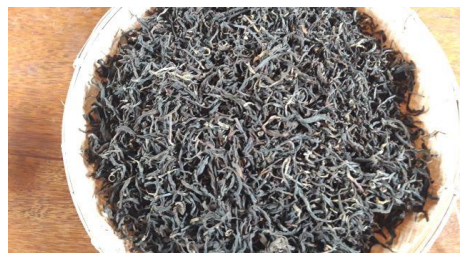
ຮູບທີ 4: ຊາຂຽວໃນຮູບຮ່າງຢຽດຊື່ກ້ຽວພັນກັນ