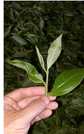
ຮູບທີ 8: ກ້ານທີ່ມີໃບຊາສາມໃບ ແລະ ຍອດທີ່ໃຊ້ມືເດັດ