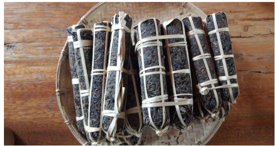
ຮູບທີ 5: ຊາທີ່ຖືກອັດໃຫ້ເປັນຮູບຊົງກອກຢາຊິກາ ແລະ ແຜ່ນເຄັກ.

ບໍ່ອະນຸຍາດໃຫ້ໃຊ້ເຄື່ອງຈັກຕັດໃບຊາຢູ່ໃນໂຮງງານ. ໃບຊາທັງໝົດຕ້ອງໄດ້ຮັບການຫຸ້ມຫໍ່ ຫຼື ອັດແໜ້ນ.