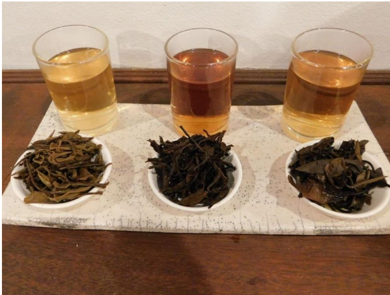
ຮູບທີ 6: ຈາກຊ້າຍຫາຂວາ ສີຂອງໃບຊາຂຽວ, ຊາແດງ ແລະ ຊາຂາວ ທີ່ໄດ້ຜ່ານການຊົງ