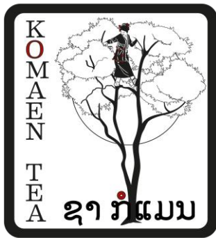
ຮູບທີ 9: ການໝາຍຜະລິດຕະພັນຊາກຳແນນ