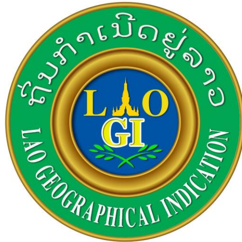
ຮູບທີ 10: ການໝາຍຖິ່ນກຳເນີດແຫ່ງຊາດ

ການຫຸ້ມຫໍ່ແຕ່ລະອັນ ຕ້ອງໝາຍເລກລະຫັດໃສ່ ເພື່ອໃຫ້ສາມາດກວດກາຄືນຂອງຜະລິດຕະພັນໄດ້, ເຊິ່ງຄວນປະກອບດ້ວຍ: