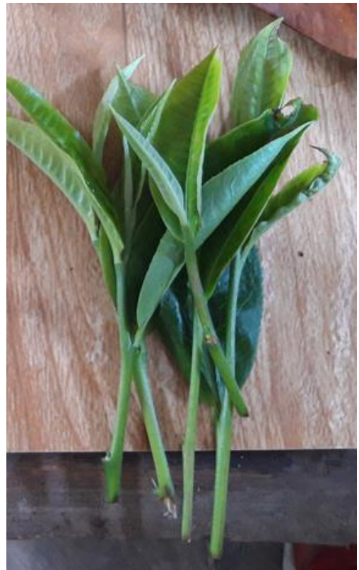
ຮູບທີ 1: ໃບຊາສີດຈາກຕົ້ນຊາບູຮານ ຄົນທ້ອງຖິ່ນເອີ້ນ ວ່າ “ຊາຕົ້ນໃຫຍ່”

ມີຊາແນວພັນອື່ນທີ່ມີການຜະລິດໃນພື້ນທີ່ຖິ່ນກຳເນີດ ເຊິ່ງໄດ້ນຳ ເອົາແກ່ນຊາຈາກປະເທດຈີນ ເຊິ່ງຄົນທ້ອງຖິ່ນເອີ້ນວ່າ “ຊາຕົ້ນ ນ້ອຍ” ບໍ່ສາມາດເອີ້ນວ່າຊາກໍແມນ ເຊິ່ງລັກສະນະໃບຊາຈະຕ່າງ ຈາກຊາກໍແມນ ເຊັ່ນ: ກິ່ນຫອມໜ້ອຍກວ່າ ແລະ ມີຂົນ ບໍ່ກ້ຽງ.